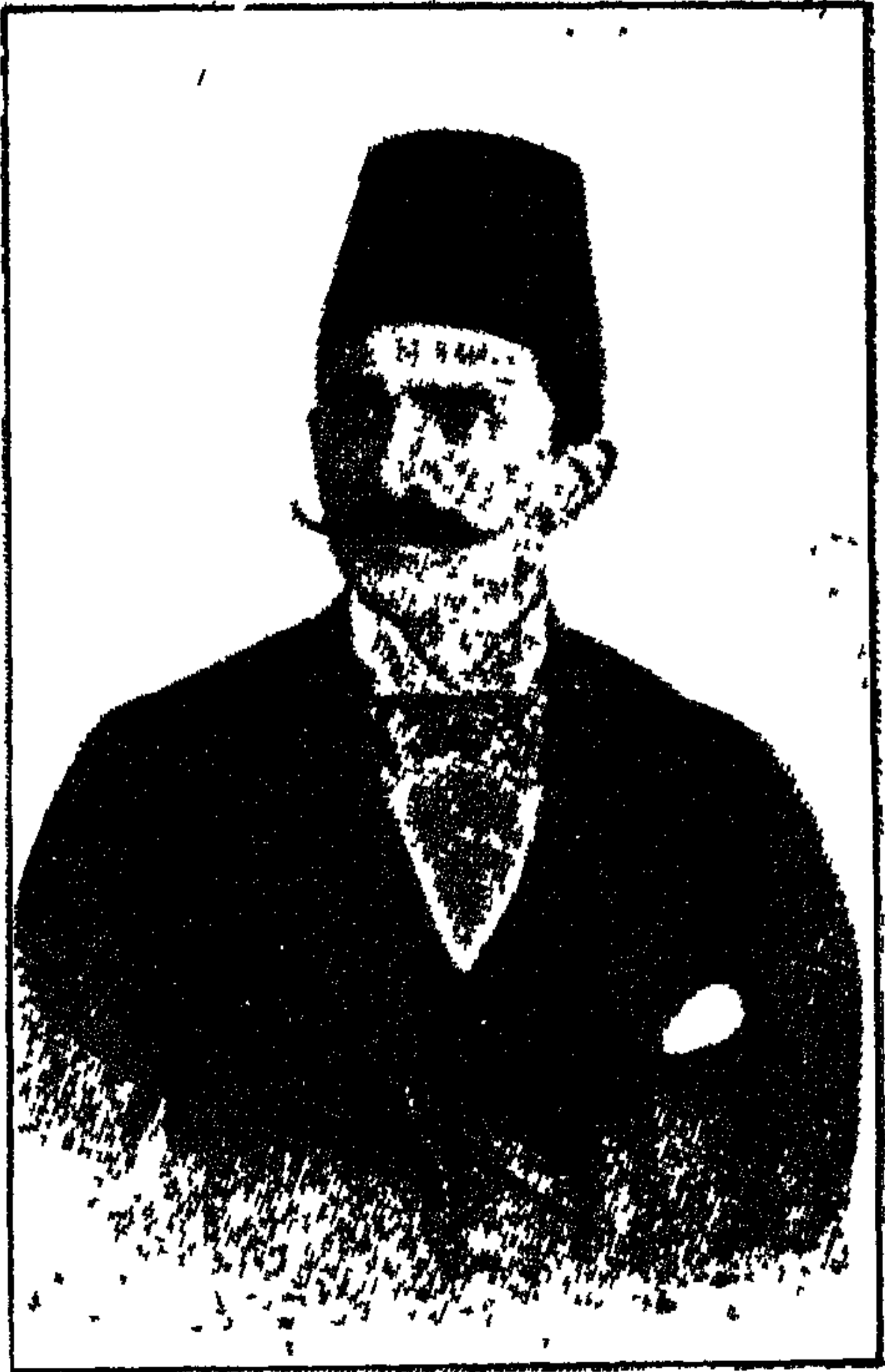
السيخ سلامه حجازى أمير المغنين