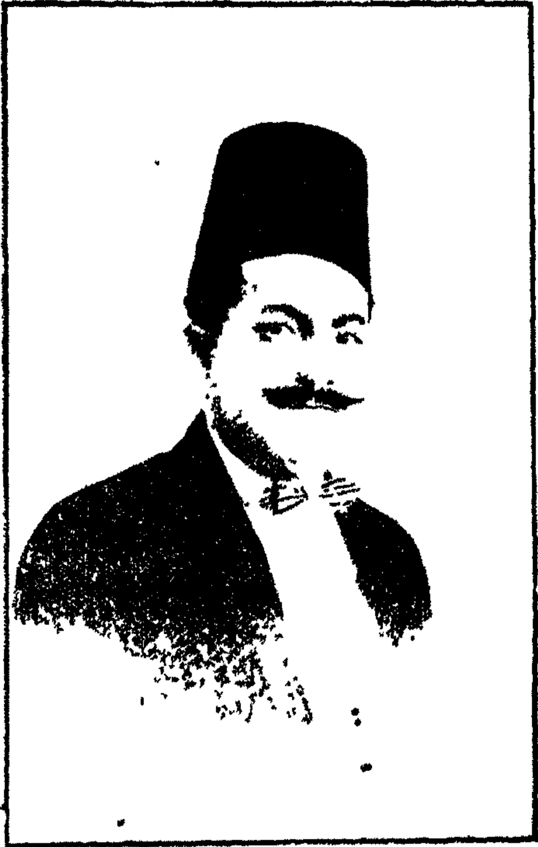
محمد حسن السويسي القانوني الشهير