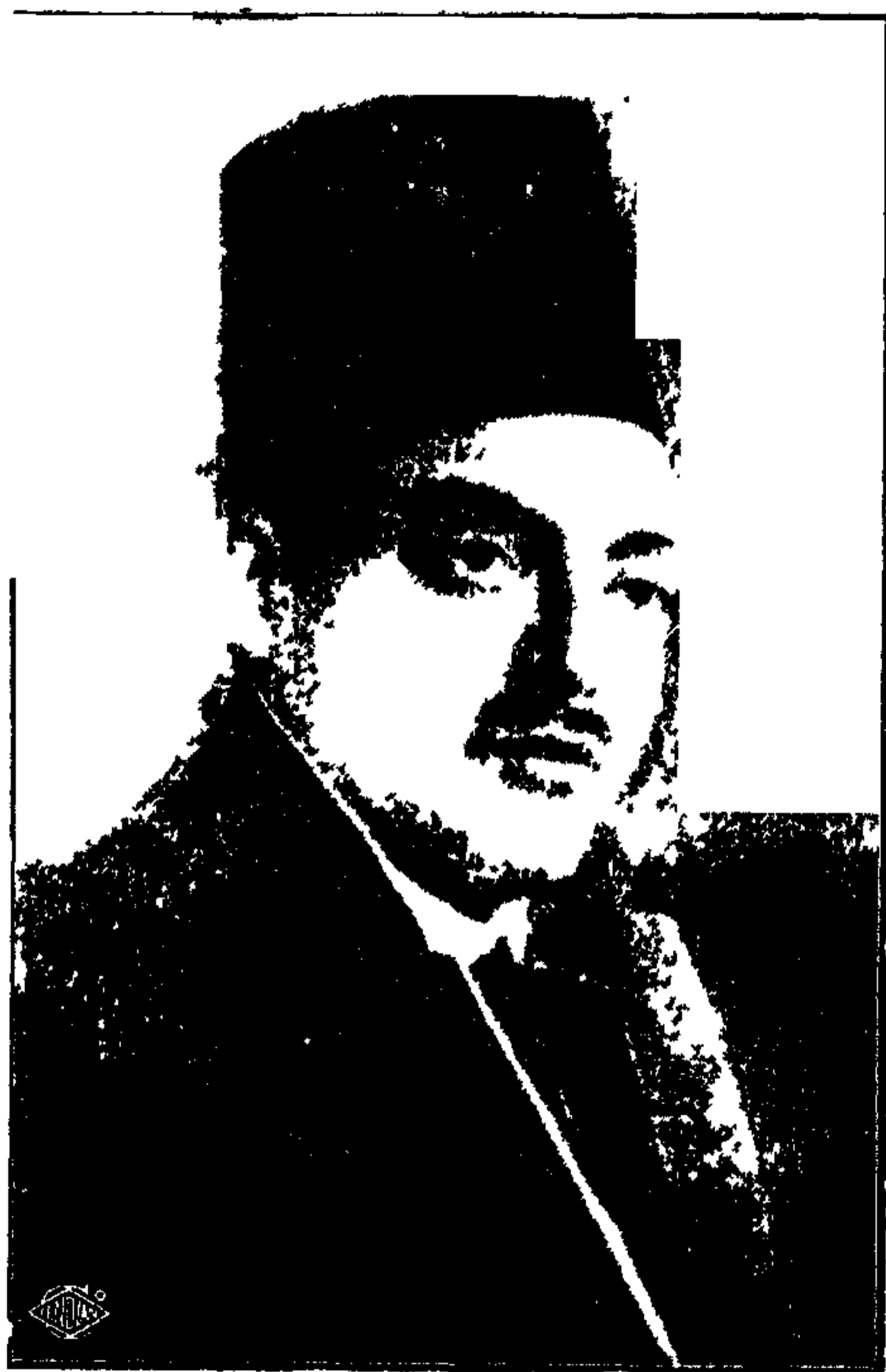
الشيخ زكريا احمد