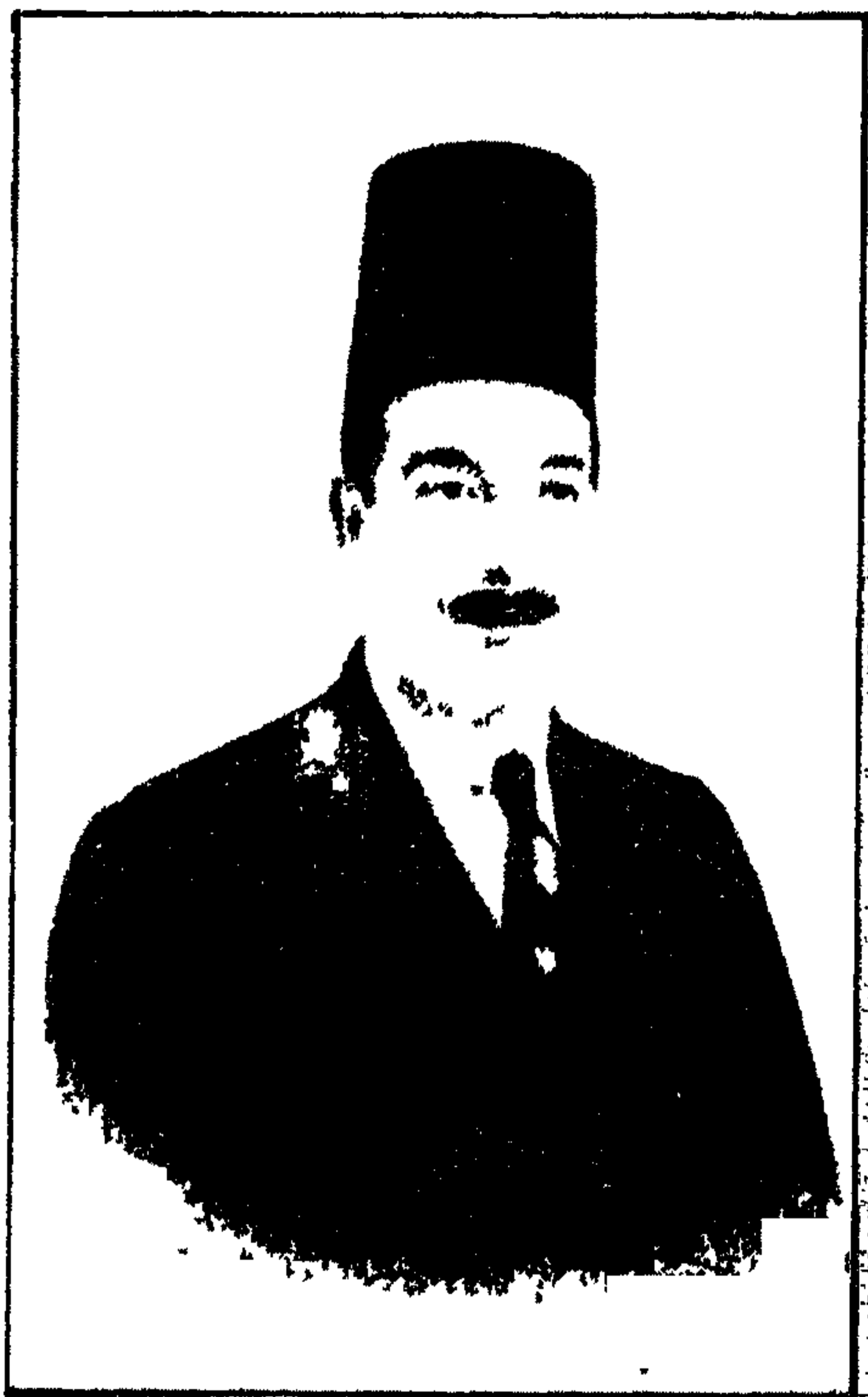
محمد القباني الملحن والقانونجي الشهير