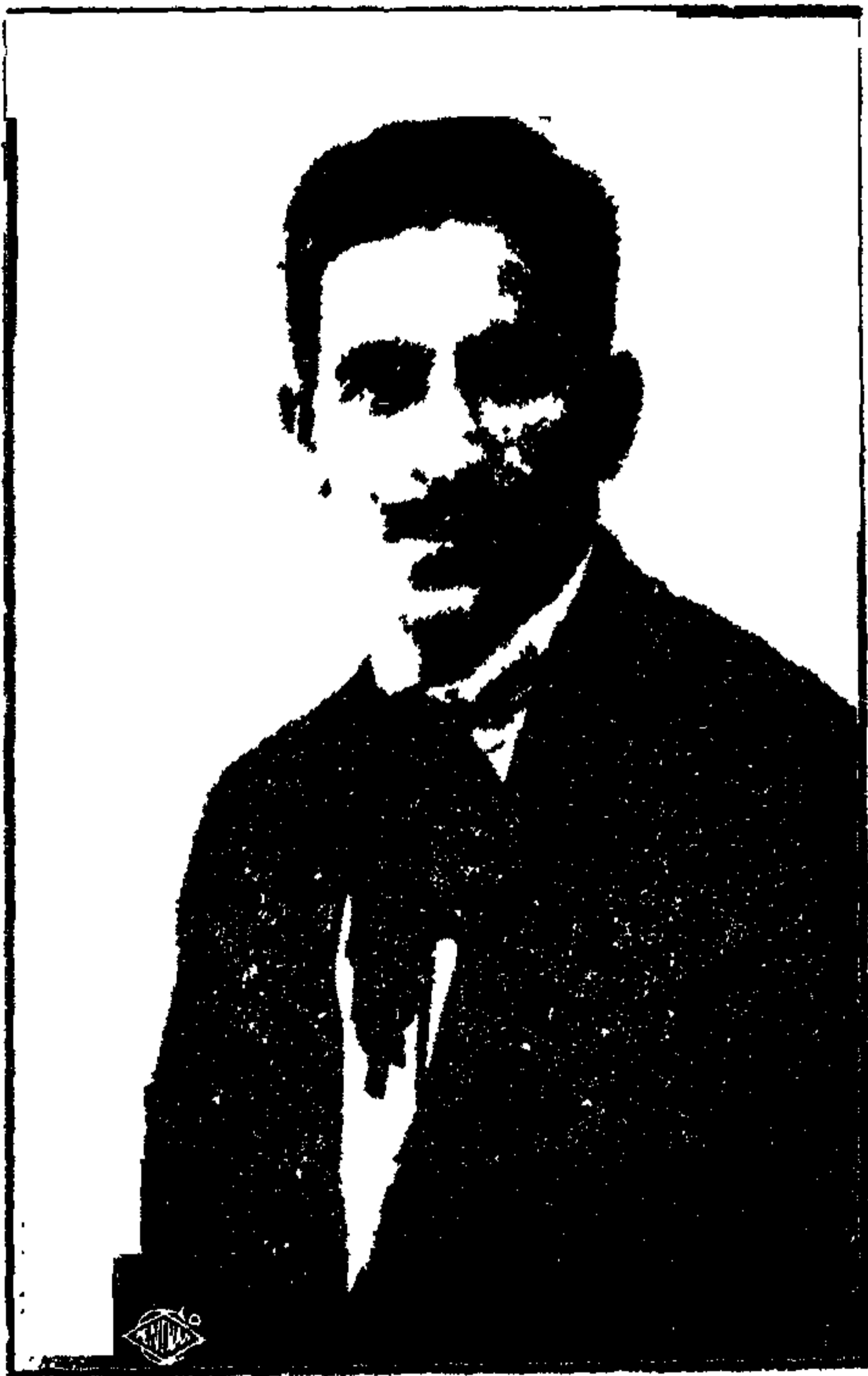
محمد هارون الموسيقى الشهير