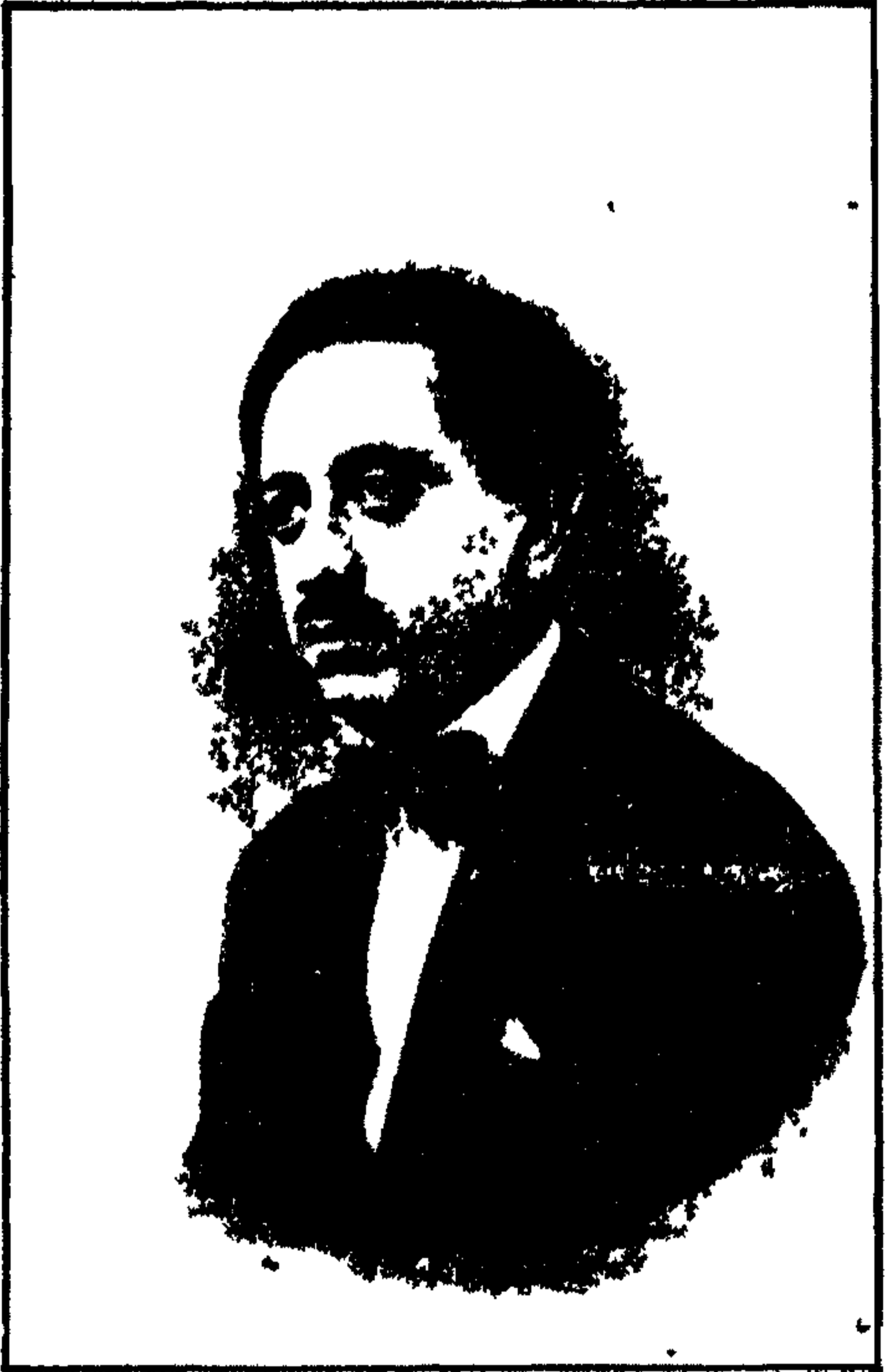
سامى شوا الموسيقى النابغه