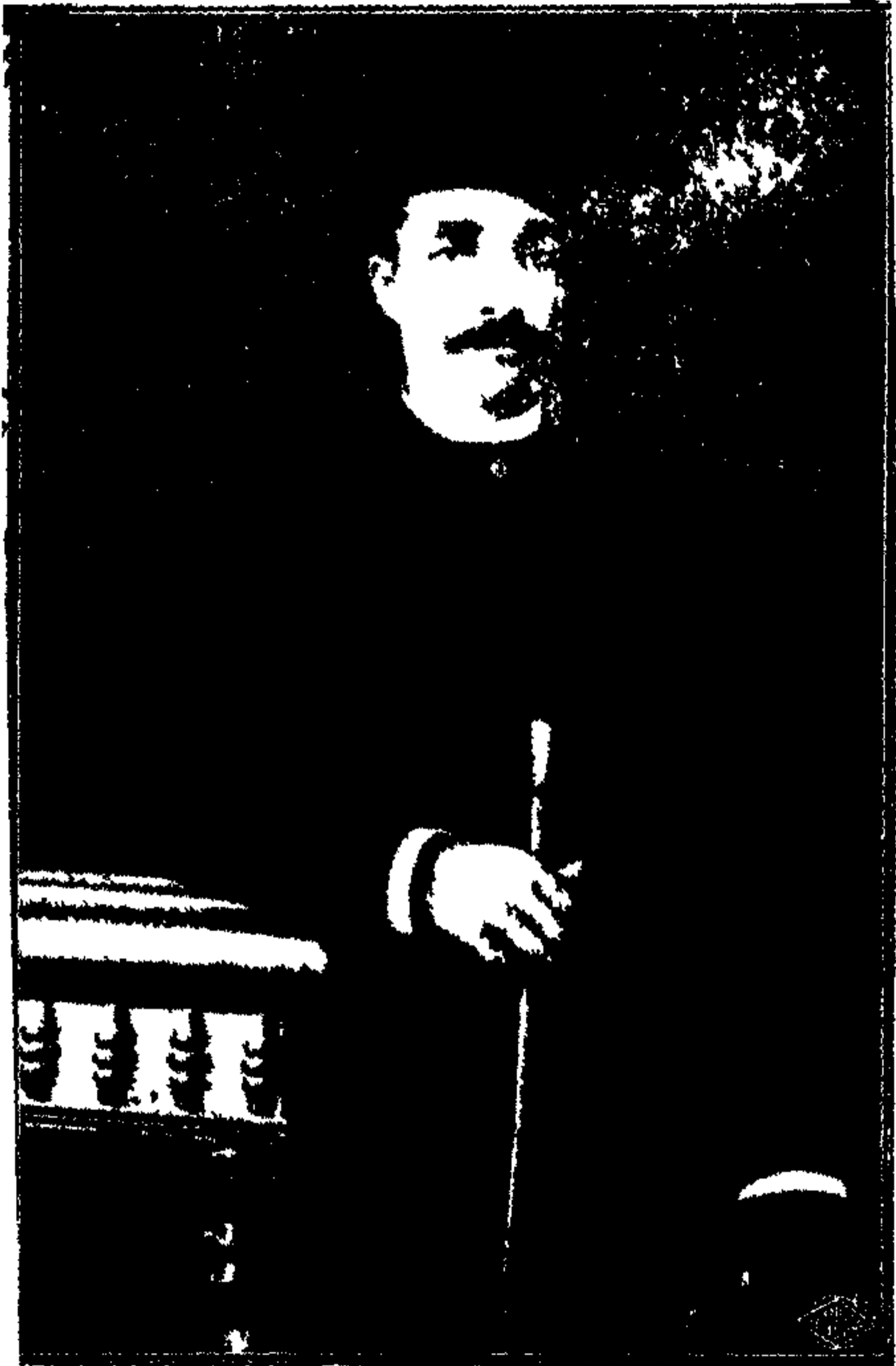
عبد الحمولى المبنى السهر