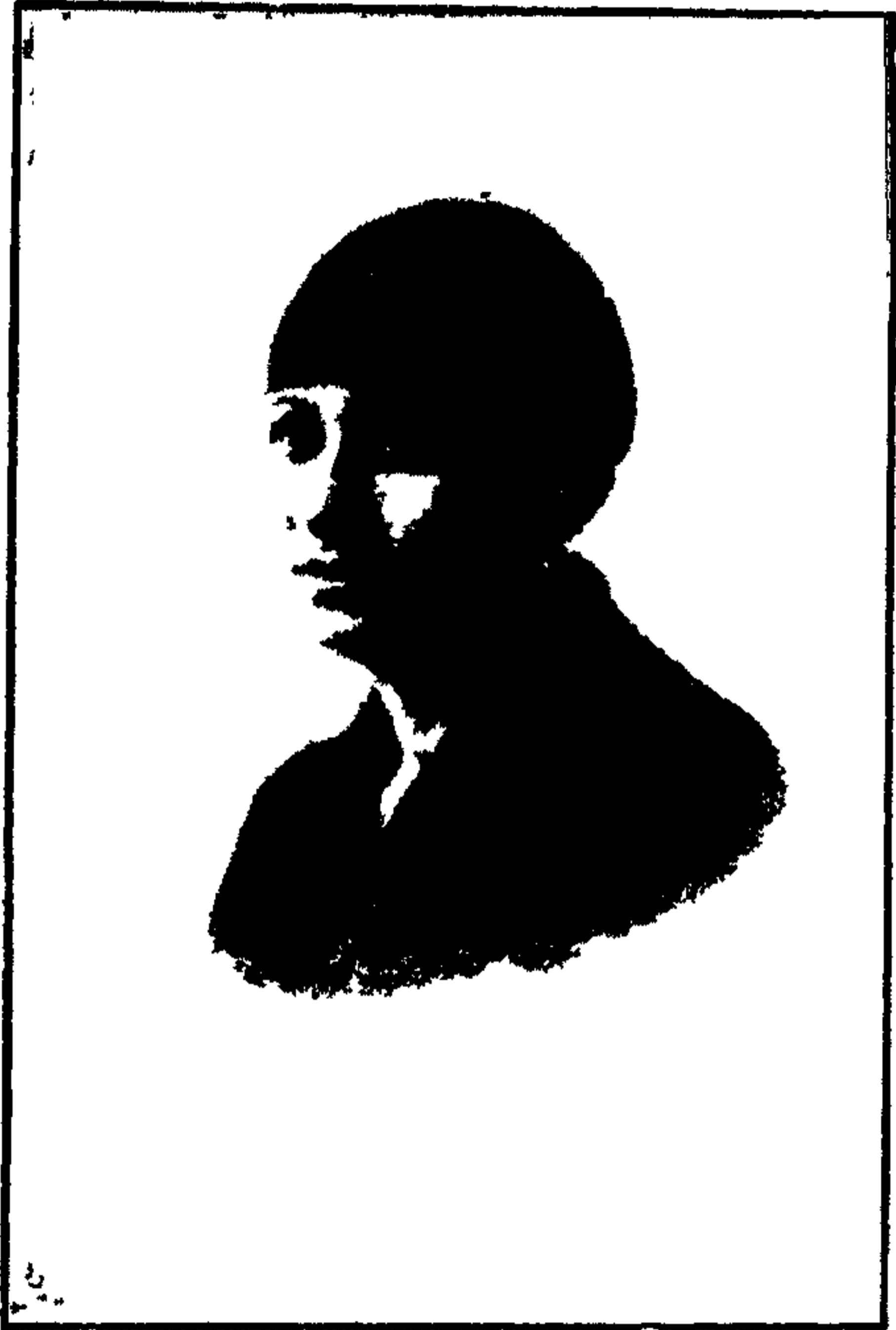
الآنسة أم كلثوم المعينة الدائفة الصيت