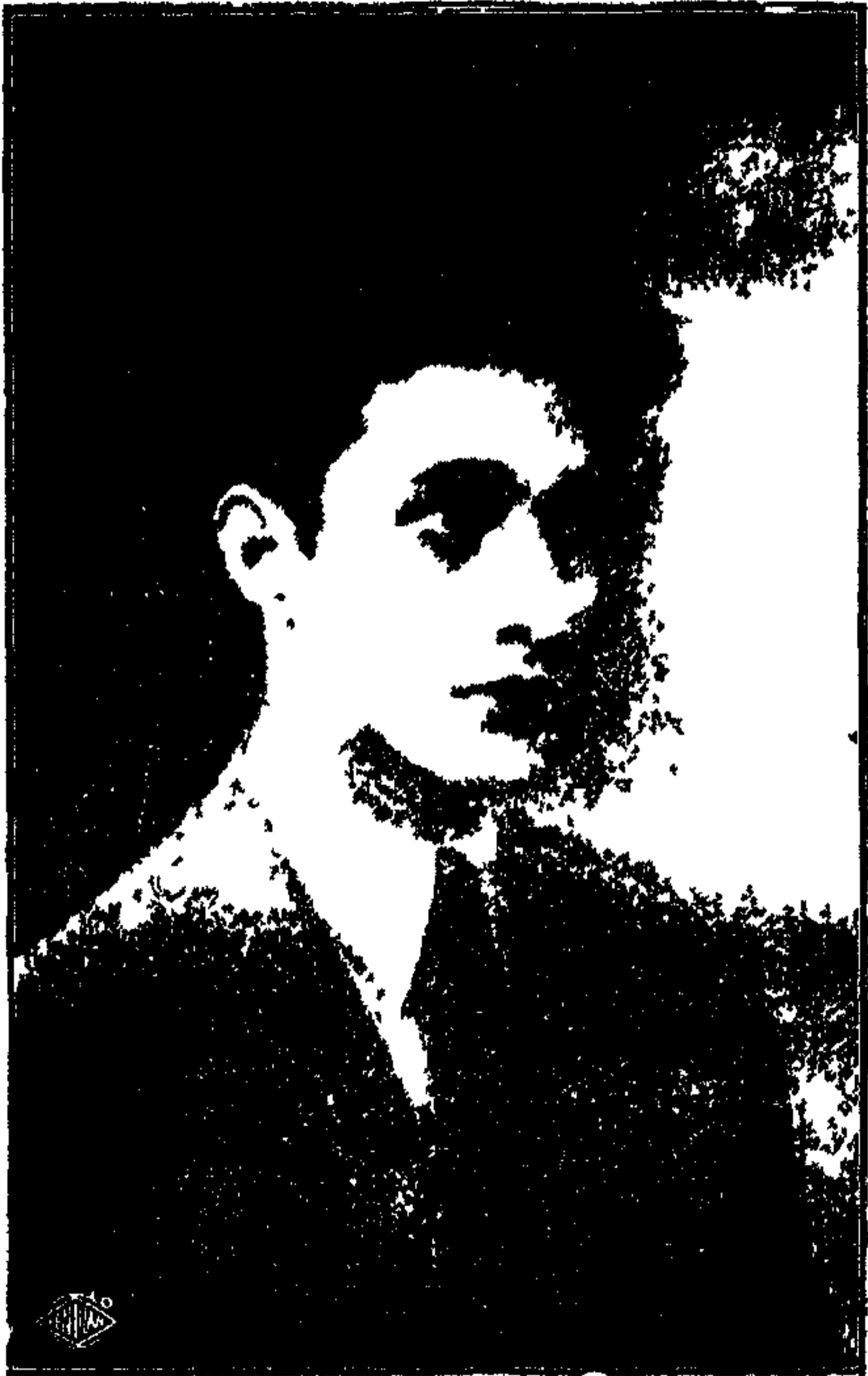
محمد عبد الوهاب المعنى الذئاع اصبت