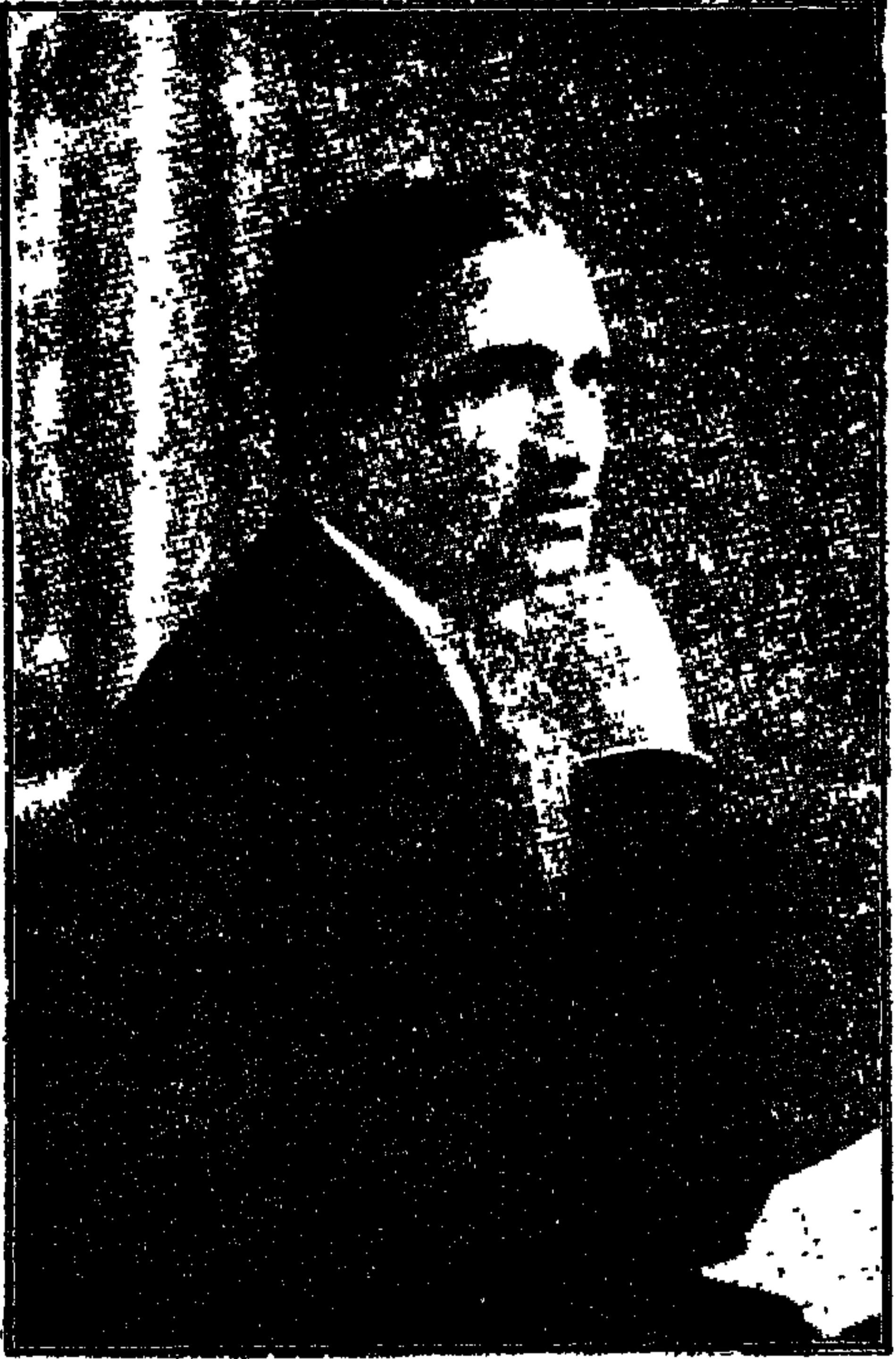
الشيخ سيد درويش الملحن الشهير